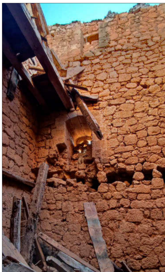
Interior tras el reciente derrumbe.