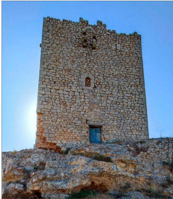
Torre de Moñux.

La Torre de Moñux forma parte de Patrimonio Histórico Español y cuenta con la declaración de Bien de Interés Turístico Cultural en la categoría de castillo desde el año 1949. Está situada en un cerro desde el que se divisa el valle del arroyo del Molinillo, en la Tierra de Almazán y vigila el acceso al Campo de Gómara. Posiblemente la torre debió formar parte de un sistema defensivo más complejo. Tiene planta cuadrada edificada en mampostería, sillares en las esquinas. Conserva algunas almenas, vanos con arco de medio punto y una puerta en alto con un arco de medio punto. Es de tres alturas y recientemente ha perdido la techumbre por su mal estado de conservación. La ausencia de almenas hace pensar que tuviera una altura mayor.